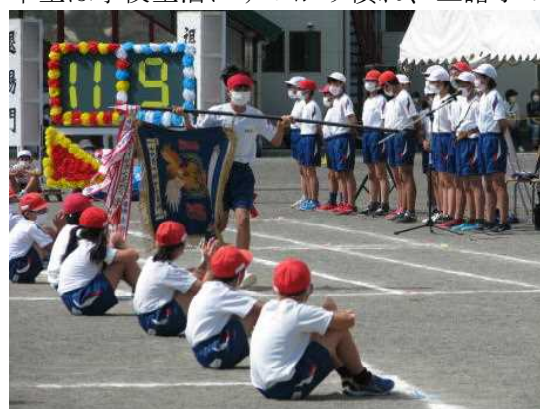
「たまもろ魂をみせた秋季大運動会」

明日3月23日(水)、令和3年度の卒業証書授与式を举行します。141名の6年生が卒業証書を手にしめます。この一年間、コロナ禍の中にあっても、最高学年として学校生活の様々な場面でリーダーとなり、期待にこたえる活躍ぶりでした。玉諸小で学んだことを生かし、立派な中学生になることと思います。4月には在校生もそれぞれ進級し、一つずつ学年が上がります。子どもたちは、この一年間、集団生活の中、学校でなければ学べないことを学んできました。1年生は学校生活にすっかり慣れ、玉諸小の一員として自信あふれる言動が数多く見られるようになりました。