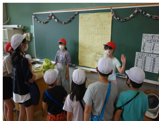
「フェスティバルたまもろ2021」から