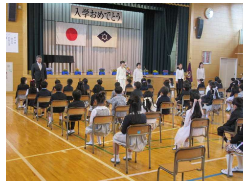
【令和5年度入学式の様子】

玉諸小学校は、元気いっぱいの新1年生96名を迎え、全校児童670名、教職員55名で、令和5年度をスタートしました。子供たちには気持ちを新たに、自己を見つめ直し、より高い目標を掲げて学校生活を送ってほしいと願っています。この一年が子供たちにとって、かけがえのない充実したものになるよう、また、未来への大きな夢をはぐくむ確かな一歩となるよう、私たち玉諸小学校教職員一丸となって教育活動を展開していきます。そして、学校、家庭、地域が強く手を携えて「玉諸小教育」を進めていきたいと考えています。一年間どうぞよろしくお願いたします。