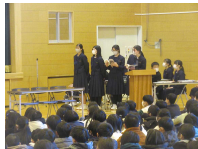
東中生による説明の様子

1月26日（金）に、東中学校から本校の卒業生10名が来校し、2月29日（木）には、南中学校から卒業生など3名が来校し、中学校生活について6年生が話を聞く会が行われました。中学校入学に向けての心構えや中学校生活や学校行事、部活動などについて詳しい説明、アドバイスなどをもらいました。優しく頼りがいのある先輩の話を聞くことで、改めて中学校生活への期待が大きくなったことと思ひます。また、東中学校では、昨年オープンスクールも行われ、多くの6年生が参加しています。このような行事を通して、中学進学への緊張感や不安が軽減され、「中1ギャップ」などなく、スムーズな中学校進学につながると思ひます。