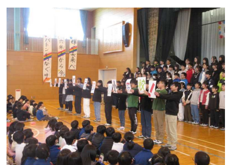
6年生の呼びかけの様子