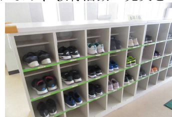
凡事徹底の取組(かかとピタッ!)

今年度スタートしたコミュニティ・スクールでしたが、家庭や地域の皆様のご協力・ご支援により、教育活動の充実を図ることができました。今後も「地域とともにある学校」づくりを進めていきます。