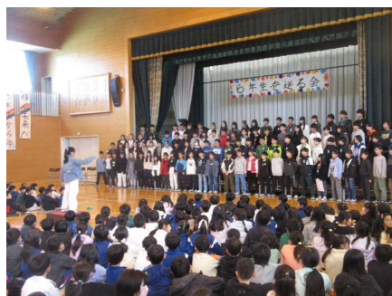
6年生の合唱「ぼくらの日々」の様子