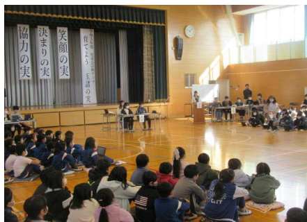
第2回児童総会の様子

話し合いでは、今年度の児童会テーマ「育てよう玉諸の実」をもとに、「笑顔の実」、「決まりの実」、「協力の実」の3つの柱の活動や委員会活動について、成果と課題をまとめました。その中では、課題となる点（落ち着いた生活）については、今年度中にさらに取組を続けることが確認されました。自分たちの学校生活をしっかりと見つめ直し、さらに改善に向け、諦めず取組を工夫しようとする子供たちの姿に、たのしみさを感じました。また、現本部役員から新本部役員への引継ぎ式が行われました。新本部のメンバーを中心に、これまでの活動をもとに、さらに玉諸小の児童会活動が活性化されていくことでしょう。