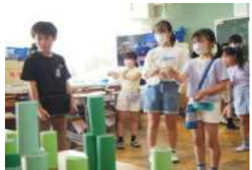
「フェスティバルたまもろ2023」から