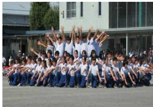
「It's 玉諸 show time」

子どもたちには、残り少ない今の学級、学年での日々を大切にするとともに、これまで学んだことをもとに、自信と誇りを胸に新しい学年、新しい学校へと進んでほしいと願っています。この一年間、子どもたちは、伸び伸びと、また安全に落ち着いた学校生活を送ることができました。子どもたちの成長を、学校・家庭・地域とともに喜び合いたいと思います。今年度の本校の教育活動に、深いご理解と温かいご協力をいただきありがとうございました。来年度も変わらぬご支援をいただけますよう、よろしく願いいたします。