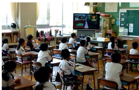
交通安全のDVDを視聴する1年生

毎年、年度始めの時期に、1年生と3年生を対象に正しい歩行の仕方や自転車の乗り方を学習し、交通安全に対する意識を高めることをねらいとして交通安全教室を実施しています。1年生は安全な横断歩道の渡り方や歩き方について、3年生は安全な自転車の乗り方について、今年度はDVDを視聴して学習しました。