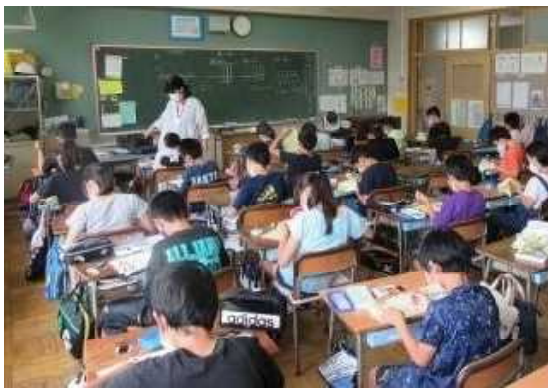
家庭科で裁縫に取り組む5年生