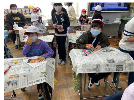
繁盛しているプラバン作りのお店

さわやかな秋晴れに恵まれた11月16日(月)に「フェスティバルたまもろ2020」を開催しました。これは、児童会を中心として、自分たちの力で大きな行事を計画し実践する過程を通して、児童の自主性・創造性を高め、責任感や協力する態度を養うこと、縦割り活動を通して異学年間の子どもの同士の友好を深めることを目的に行うものです。また、集団としての共同作業を通して、学校生活に変化を与え、より豊かで楽しいものにするこもねらっています。