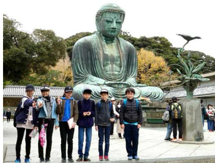
高德院大仏の前で

秋も深まった11月24日（火）・25日（水）の1泊2日、6年生が修学旅行に行ってきました。今年度は、新型コロナウイルス感染拡大により5月から延期となっていました。子どもたちの健康・安全を第一に、ガイドラインなどを踏まえ、方面や内容を再検討し、感染症対策を万全にして、ようやく実施の運びとなりました。