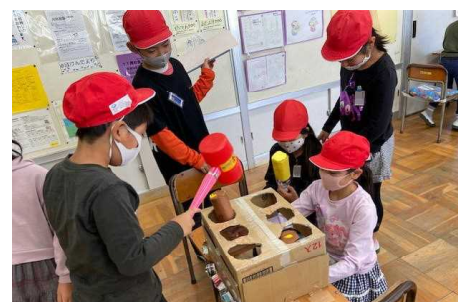
手作りのもぐらたたきのお店

密になることを防ぐため、今回初めて校庭に「お店」を5つ設けたことをはじめ、校舎内の「お店」の間隔を空ける、入店人数を絞る、消毒係を新設するなどの対策をとりました。また、保護者の皆様、地域の皆様にご参加いただくことはできませんでしたが、子どもたちを温かく見守り、励ましの言葉をいただき、ありがとうございました。