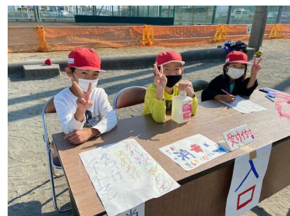
受付では消毒の呼びかけも

今年度のテーマ「みんなで楽しもう！キラキラスマイルあふれるフェスティバルたまもろ★」のもと、当日は、縦割り班ごとに工夫して作ったシューティングゲーム、宝探し、脱出ゲームなど24の「お店」をお互いに巡り、子どもたちが楽しく活動する姿が見られました。上級生は下級生の面倒をよく見て、下級生は上級生の言うことをよく聞いて、異年齢集団で協力し合って、明るい笑顔で一日活動することができました。