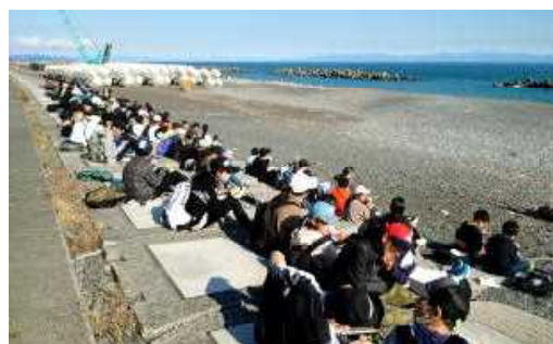
焼津天文科学館前の海岸での昼食

テーマ「6年生100人の最強の絆で最高の2日間にしよう!!」のとおり、最高学年にふさわしく、6年生全員で協力合って楽しく充実した思い出に残る修学旅行となりました。