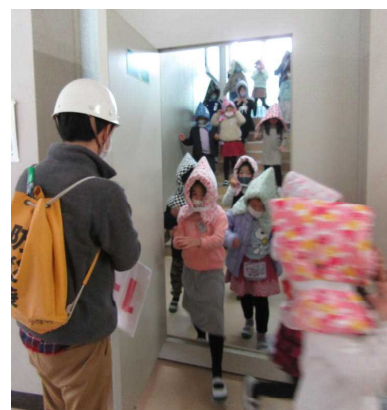
防火扉をくぐって避難する1年生

災害は、いつどこで起こるか分かりません。大切な命を守るために、お子さんと危険な場所の確認をするとともに、登下校中や帰宅後に災害が発生した場合に具体的にどのように行動するのか、家以外に家族が集まる場合はどこにするのか決めておくなど、普段から備えておく必要があります。また、各ご家庭に昨年4月に配付した「いざという時のために」（家庭掲示用）についても改めて確認をお願いします。子どもたちのかけがえのない命を災害から守るため、ご理解、ご協力をよろしくお願いします。