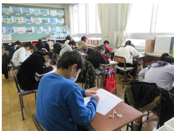
真剣にテストに取り組む6年生

大寒の1月20日から立春の2月3日までは一年で最も寒い時期と言われるとおり、気温の低い日が続いています。日中に日差しがあっても気温が上がらず、暖かい春が待ち遠しく感じられます。