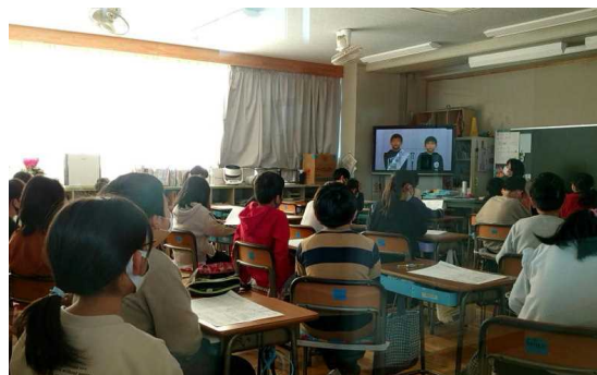
校内テレビ放送で行った立会演説会

立会演説会の後、今回は新たに取り入れたマークシート方式で投票を行いました。即日開票の結果、来年度の児童会本部の体制が整いました。よりよい玉諸小をめざして、新児童会本部役員を先頭に高学年全員が、全校のリーダーとして積極的に活動していくことを期待しています。