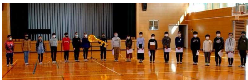
引継ぎ式に臨む現本部役員(向かって左側)と新本部役員(同右側)

今年度の児童会活動を振り返り、来年度へつなげていくための第2回児童総会は、感染症予防のため第1回と同様に、書面による開催となりました。3年生以上の各学級から出された質問や意見に対して、本部や各委員会から来年度を見据えた回答が児童会だよりによって伝えられました。今年度の児童会テーマ「かがやかせよう玉諸の星！」をめざして、みんな