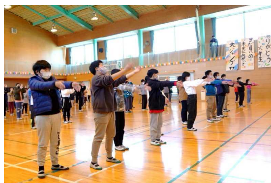
6年生にエールを送る5年生

「ありがとう6年生 まだ見ぬ未来に向かって大ジャンプ!!」のテーマのもと、2月19日(金)に「6年生を送る会」が開かれました。5年生を中心とする新児童会本部が実行委員会を組織し、企画、運営する初の大きな行事です。