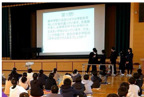
クイズ形式での東中の説明

1月28日(木)に、東中学校から本校の卒業生5名が来校し、中学校生活について6年生が話を聞く会が開かれました。中学校入学に向けての心構えや、中学校生活や学校行事、部活動などについて詳しい説明、アドバイスなどをもらいました。優しく頼りがいのある先輩の話聞くことで、改めて中学校生活への期待が大きくなったことと思ひます。中学進学への緊張感や不安が軽減され、スムーズな進学につながると思ひます。