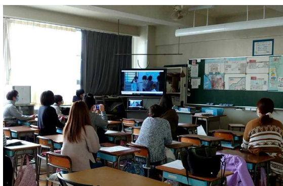
ビデオによる授業参観

授業参観については、感染症予防のため今回もビデオ視聴とさせていただきますが、一年間のまとめとしての発表を中心とした授業で、子どもたちの成長ぶりをご覧いただけたことと思います。一日一日の成長は小さなものでも、それを一年間積み重ねることで、子どもたちは大きく成長します。そのもとになる「毎日、安心して登校し、落ち着いた学校生活を送ること」ができたのは、温かい家庭があるからこそです。子どもたちの健やかな成長のために、今後も学校と家庭とで手を携えて教育活動を進めていきたいと思ひます。