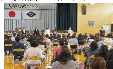
【令和3年度入学式の様子】

玉諸小学校は、元気いっぱいの新1年生107名を迎え、全校児童702名、教職員62名で、令和3年度をスタートしました。子どもたちには気持ちを新たに、自己を見つめ直し、より高い目標を掲げて学校生活を送ってほしいと願っています。この一年が子どもたちにとって、かけがえのない充実したものになるよう、また、未来への大きな夢をはぐくむ確かな一歩となるよう、私たち玉諸小学校教職員一丸となって教育活動を展開していきます。そして、学校、家庭、地域が強く手を携えて「玉諸小教育」を進めていきたいと考えています。一年間どうぞよろしくお願いいたします。